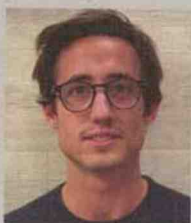
10 Roland de Heere